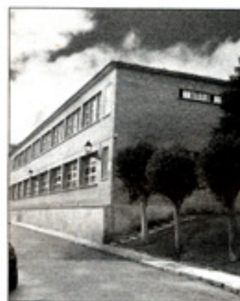
Fachada del colegio.

continuación esperamos los trámites administrativos para disponer del edificio, con lo que el próximo mes de junio de 2008 podrían iniciarse las obras".